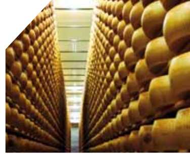
Aeroporto di Bologna G. Marconi - Passaggio traffico G. Marconi Airport, Bologna - Traffic